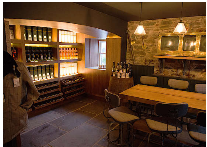
Glen Scotia Shop und Bar

2015 wurde das neue Visitor Centre bei Glen Scotia eröffnet. Dort werden für Besucher verschiedene Touren angeboten, die zeitlich zwischen 45 Minuten und zwei Stunden sowie preislich zwischen sieben und 45 Pfund liegen.