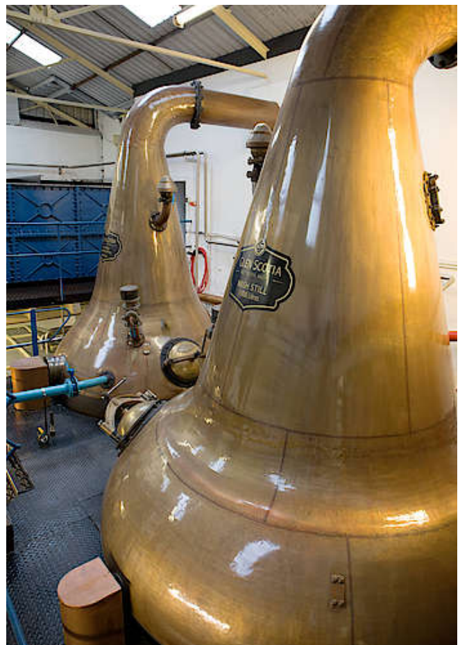
Brennblasen von Glen Scotia

Glen Scotia besitzt eine Wash Still mit einer Kapazität von 16.000 Litern und eine Spirit Still mit einer Kapazität von 12.000 Litern. Die Pot Stills sind zwiebel-förmig und haben breite, kurze Hälse. Die Schwanenhälse (Lyne Arms) haben einen eher ungewöhnlichen Aufbau, denn sie führen vom Ende des Halses fast horizontal zu den Kondensatoren.