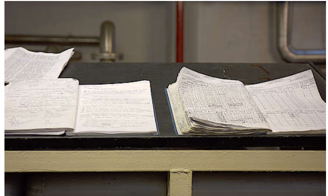
Notizbücher bei Glen Scotia

Im Jahr 1970 wurde A. Gilies & Co. Teil von Amalgated Distillers Products. Diese bauten die Destillerie zwischen den Jahren 1970 und 1982 vollständig um. Die harte Wirtschaftslage Großbritanniens während der großen Rezession den 1980er Jahren zwang die Destillerie 1984 erneut zu schließen. Sie blieb bis 1989 geschlossen, als die Gibson International ADP Glen Scotia erwarb. 1994 stellte die Brennerei die Produktion ein letztes Mal während der Erwerbszeit ein. In diesem Zeitraum wechselte der Besitz von Gibson an die Glen Catrine Bonded Warehouse Ltd. 2014 wurde die Brennerei an die Private Equity Firma Exponent verkauft unter der sie bis heute tätig ist.