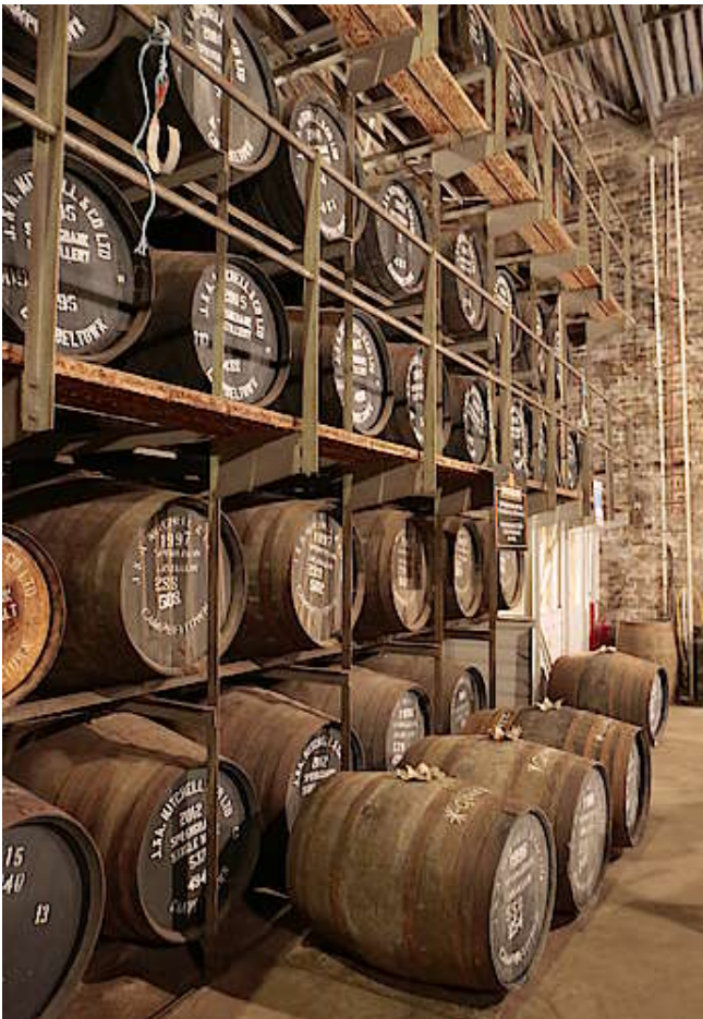
Im Lagerhaus von Springbank

Springbank verfügt vor Ort über einen Lagerhauskomplex, der sowohl aus 'dunnage -', als auch aus 'racked warehouses' besteht. Die Brennerei verwendet für ihren Reifungsprozess eine Kombination aus verschiedenen Fässern, abhängig von der Absicht des Master Distillers. Dazu gehören Ex-Bourbonfässer, sowie Sherry Hogsheads und Sherry Butts.