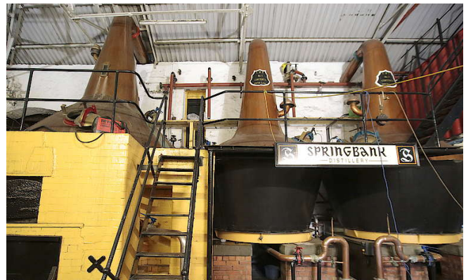
Brennblasen von Springbank

Springbank hat eine ziemlich ungewöhnliche Ausstattung. Es gibt eine Wash- und zwei Spirit Stills. Die Wash Still besitzt eine Kapazität von 10.000 Litern und die beiden Spirit Stills umfassen jeweils 6.000 Liter. Alle drei Single Malts, die in der Brennerei produziert werden, sind unterschiedlich destilliert. Dies trägt zu ihrem unterschiedlichen Geschmack bei. Springbank wird zweieinhalb Mal destilliert, Longrow zweimal und Hazelburn wird dreimal destilliert. Alle Pot Stills haben eine traditionelle 'Speyside'-Form, mit breiten sphärischen Deckeln und hohen konischen HälSEN. Darüber hinaus ist die Brennerei eine der wenigen in Schottland, die ihre Flaschen vor Ort abfüllt.