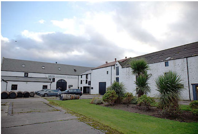
Innenhof von Glengyle

Die verschiedenen Kilkerran Work in Progress Abfüllungen (WiP) hatten zuvor in der Auswahl der Fässer immer variiert. Es wurden reine Bourbonfass-Abfüllungen wie Kilkerran WiP 6 oder auch reine Sherryfass-Whiskys wie Kilkerran WiP 7 vorgestellt.