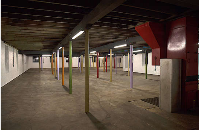
Malzboden von Springbank

Springbank ist eine der letzten Brennereien in Schottland, die ihr Malz zu 100 Prozent selbst herstellt und nicht von industriellen Mälzereien bezieht.