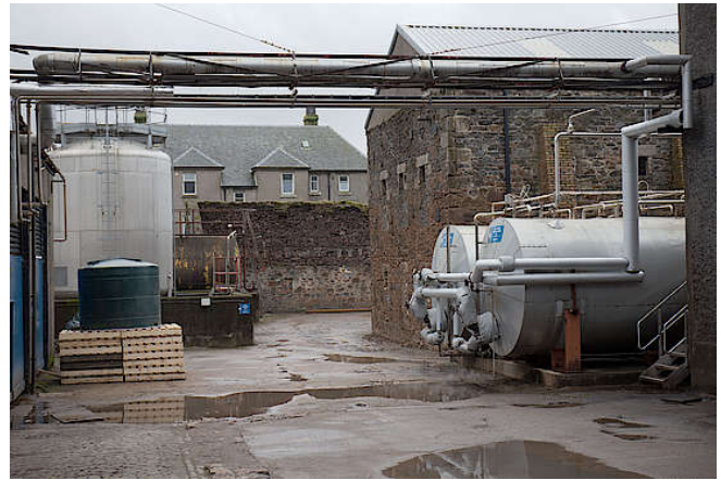
Produktionsbereich von Glen Scotia

Glen Scotia bezieht ihr gesamtes Malz von der Greencore Mälzerei, die im Südwesten Schottlands liegt. Das verwendete Malz ist leicht rauchig, was auch dem Whisky eine sanfte Rauchigkeit verleiht. Der Geschmack ist dadurch dem des Campbeltown-Nachbarn Springbank ähnlich.