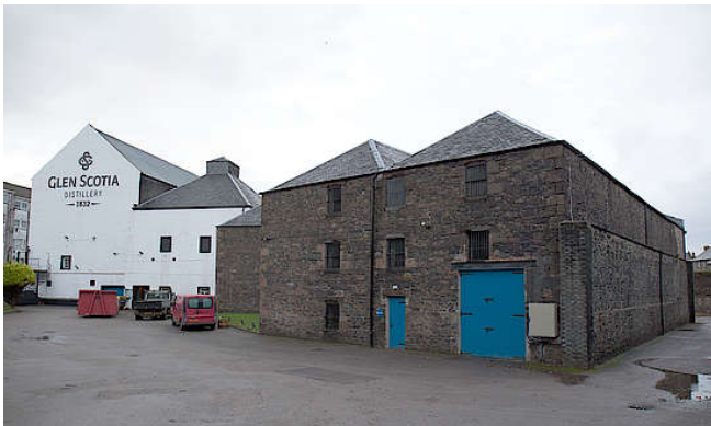
Lagerhäuser von Glen Scotia

Glen Scotia verwendet zum Reifen ihres Single Malts amerikanische Eichenfässer und hat vor Ort ein sogenanntes 'bonded warehouse', welches bis zu 7.500 Fässern Platz bietet.