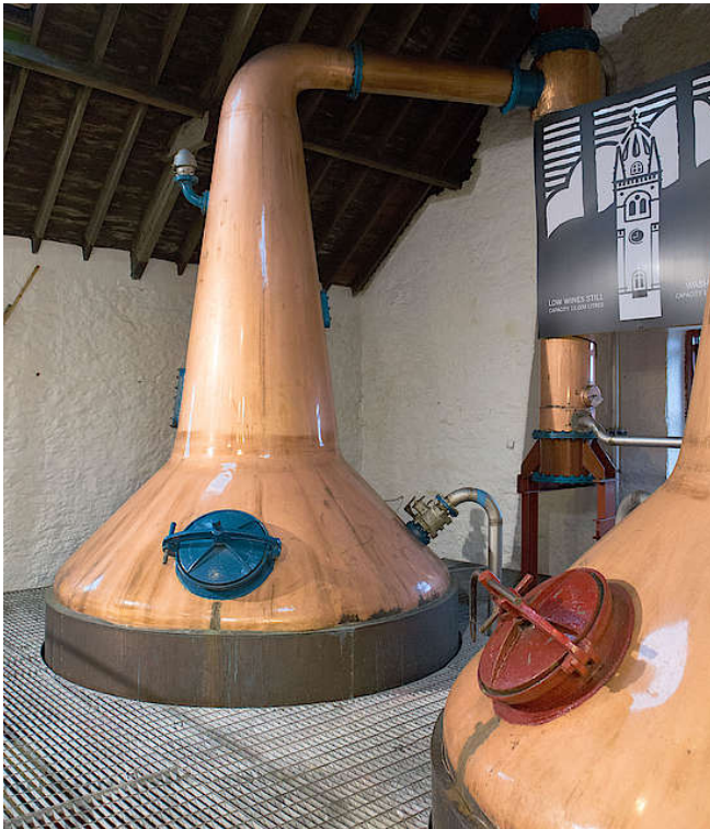
Brennblasen von Glengyle

Das Equipment für die Destillation wurde von der Ben Wyvis Brennerei übernommen. Die Wash Still fasst 18.000 Liter, die Spirit Still 15.000 Liter. Auch sie war ursprünglich eine Wash Still und wurde hier in der Glengyle Brennerei umfunktioniert. Der erste Brenndurchgang liefert 21-23% vol., das Herzstück des zweiten Brennvorganges wird mit 68% vol. im Spirit Receiver gesammelt.