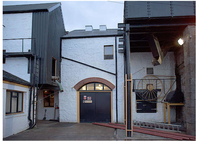
Brennhaus von Springbank

Die Springbank Destillerie bezieht ihr Wasser aus dem Crosshill Loch. Die Kapazität der Brennerei liegt bei etwa 2 Millionen Litern pro Jahr. Springbank ist eine der wenigen Brennereien in Schottland, die alle Produktionsprozesse vor Ort ausführt. Das heißt, sie realisiert alle Schritte, von der Auswahl der Gerste, bis hin zur Abfüllung in die Flaschen, selbst. Campbeltown war einmal das Herz der schottischen Whisky-Produktion, aber heute sind leider nur noch drei Brennereien in der Stadt aktiv.