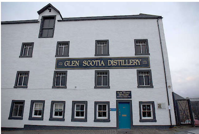
Außenansicht von Glen Scotia

Wie bei vielen anderen Destillereien wurde auch bei der Campbeltown-Brennerei Glen Scotia die ursprüngliche Palette um No-Age-Abfüllungen, das heißt Abfüllungen ohne Altersangabe, ergänzt. Die 'Distillery Select' Abfüllung beinhaltet mehrere Batches mit stark rauchigem Whisky. Eine solche Veröffentlichung gab es zuletzt im Jahr 2006. Desweiteren werden seit 2018 etwa halbjährlich Einzelfassabfüllungen der Brennerei veröffentlicht. Unabhängige Abfüllungen der Brennerei gibt es nur wenige. Gordon & MacPhail veröffentlichte ein paar, darunter eine Cask Strength Edition aus dem Jahr 1992.