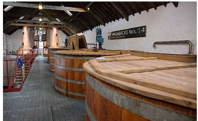
Washbacks von Glengyle

In vier Gärbehältern (Washbacks) aus Lärchenholz wird das erhaltene 'wort' dann mit Hefe zum Gären gebracht. Die Behälter fassen jeweils 30.000 Liter, werden aber nur mit 25.000 Litern 'wort' gefüllt, um ausreichend Platz für aktive, sich ausdehnende Flüssigkeit zu lassen. Nach 70 bis 110 Stunden ist das Bier mit 5% Alkoholgehalt fertig. Die Glengyle Brennerei betont auf ihrer Homepage, dass hier durchaus noch Platz für weitere Gärbehälter ist.